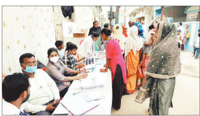
शिविर में मरीजों का परीक्षण करते चिकित्सक।