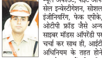
लंबित अपराधों का निराकरण करने के निर्देश

सोमवार को एसपी वैभव बैकर ने जिले के पुलिस अधिकारियों की बैठक ली। इस दौरान एसपी ने कहा कि पुलिस अधिकारी-कर्मचारी को अपने कर्तव्यों का निष्ठा से पालन करें और जनता की सेवा को सर्वोच्च प्राथमिकता दे। पुलिस का मुख्य उद्देश्य जनता की सुरक्षा और उन्नत न्याय दिलाना है। इसके लिए अनुशासन, ईमानदारी और मेहनत आवश्यक है। हम सभी को मिलकर एक टीम भावना से काम करना होगा और हर स्तर पर अपराधों को रोकने के लिए प्रयास करना होगा। एसपी श्री बैकर ने पुलिस अधिकारियों को आगामी होली त्योहार एवं रमजान महीने के उपलक्ष्य में कानून व्यवस्था को सुदृढ रखने और लोगों के बीच शांतिपूर्ण वातावरण रहे इस संदर्भ में शांति समिति की बैठक लेकर पुलिस को एक्टिव रखने के निर्देश दिए गए। बैठक में पुलिस अधीक्षक द्वारा विशेष जोर 1 साल से लंबित अपराधों के निराकरण, लंबित चिटफंड एवं धोखाधड़ी के मामलों का निराकरण, प्रतिबंधात्मक कार्यवाही, लंबित पीड़ित मुआवजा योजनाओं को पूरा करने, लंबित शिकायतों, वर्दी और बेसिक पुलिसिंग के आदर्शों का पालन करने पर दिया गया। एसपी ने गुमशुदा व्यक्तियों के मामलों पर विशेष ध्यान देते हुए पुलिस अधीक्षक ने थाना प्रभारियों को निर्देश दिए। उन्होंने ऑपरेशन मूस्कान के तहत बच्चों की तलाश और उनके पुनर्वास पर भी जोर दिया। एसपी ने कहा कि नशीले पदार्थों की तस्करी और उनके दुरुपयोग को रोकने के लिए सख्त कार्रवाई की जाए। लगातार एनडीपीएस के प्रकरण में जब्त पाहनों को राजसात एवं नशे के फाइनेंसियल इन्वेस्टिगेशन और बैकवर्ड फॉरवर्ड लिंकेज पे कार्रवाई