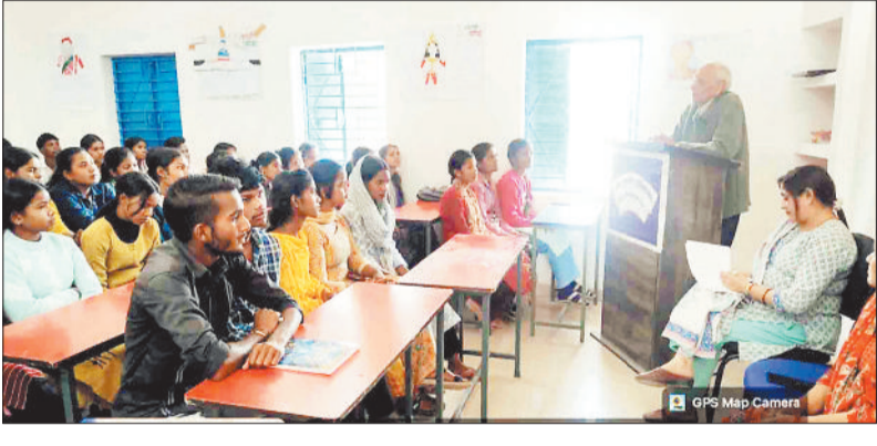
हायर सेकेंड्री मुख्य परीक्षा में शामिल हुए 7572 छात्र छात्राएं

शासकीय नवीन महाविद्यालय में आयोजित व्याख्यान में मालवीय मिशन के केंद्रीय समिति के सदस्य एवं महापति पं.मदनमोहन मालवीय का संघर्ष से भरा जीवन इसका बड़ा उदाहरण है। उन्होंने कहा पंडित लक्ष्य आसान हो जाता है तथा वह अपने हर संकल्प को पूरा करने में सफल हो सकता है। पं.मदनमोहन मालवीय का संघर्ष से भरा जीवन इसका बड़ा उदाहरण है। उन्होंने कहा पंडित लक्ष्य आसान हो जाता है तथा वह अपने हर संकल्प को पूरा करने में सफल हो सकता है। पं.मदनमोहन मालवीय का संघर्ष से भरा जीवन इसका बड़ा उदाहरण है। उन्होंने कहा पंडित लक्ष्य आसान हो जाता है तथा वह अपने हर संकल्प को पूरा करने में सफल हो सकता है।