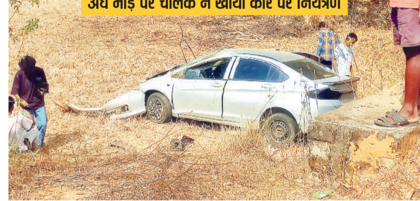
अंधे मोड़ पर चालक ने खोया कार पर नियंत्रण

जशपुर के दमरा मार्ग पर एक भीषण सड़क हादसा होने की खबर सामने आई है, जहां चराईडांड के समीप एक तेज रफ्तार सिडान कार अनियंत्रित होकर पुल के नीचे जा गिरी। बताया जा रहा है कि कार सवार सभी लोग जशपुर की ओर जा रहे थे, तभी रास्ते के एक अंधे मोड़ पर चालक ने वाहन पर से नियंत्रण खो दिया और कार सीधे पुलिया के नीचे जा चुसी। इस हादसे में कार पूरी तरह से क्षतिग्रस्त हो गई है और उसमें सवार पांच लोग घायल हुए हैं। बेहतर यह रहा कि इस बड़े हादसे के बावजूद किसी को गंभीर चोट नहीं आई और सभी सुरक्षित हैं। दुर्घटना के तुरंत बाद आस-पास के ग्रामीणों ने तत्परता दिखाते हुए मीके पर पहुंचकर घायलों को कार से बाहर निकालने और उनकी मदद करने में महत्वपूर्ण भूमिका निभाई।