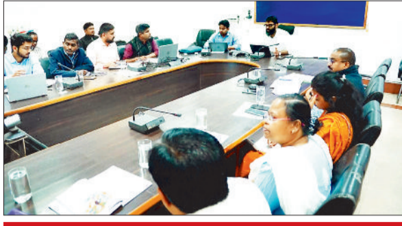
योजनाओं की प्रगति पर कलेक्टर सख्त

जशपुरनगर। जिले में कृषि क्षेत्र को नई दिशा देने के उद्देश्य से कृषि क्रांति अभियान अंतर्गत 8 मार्च से 10 मार्च तक तीन दिवसीय कृषि क्रांति एक्सपो का आयोजन किया जा रहा है। इस एक्सपो में उन्नत कृषि तकनीकों पर कार्यशालाएं एवं नवाचारों का क्रांति एक्सपो का जीवंत प्रदर्शन किया जाएगा। एक्सपो में कृषि नवाचार को बढ़ावा देने तथा प्रगतिशील किसानों को सम्मानित करने एवं नई तकनीकों के प्रसार हेतु जिला स्तरीय किसान प्रतियोगिताएं भी आयोजित की जाएगी। प्रतियोगिता में भाग लेने हेतु आवेदन पत्र ऑनलाइन व्हाट्सएप के माध्यम से अथवा अपने विकासखंड के वरिष्ठ कृषि विकास अधिकारी के पास 01 मार्च तक जमा करना अनिवार्य है। प्राप्त आवेदनों का भौतिक सत्यापन किया जाएगा तथा विजेता किसानों को घोषणा 8 मार्च को कृषि महाविद्यालय कुनकुरी में आयोजित कृषि क्रांति एक्सपो के दौरान की जाएगी। हंगी किसान प्रतियोगिताएं-कृषि के अलग-अलग क्षेत्रों में जिला स्तरीय किसान प्रतियोगिताएं आयोजित कर किसानों को सम्मानित किया जाएगा, जिसमें पारंपरिक बीज शेष पेज 4 पर