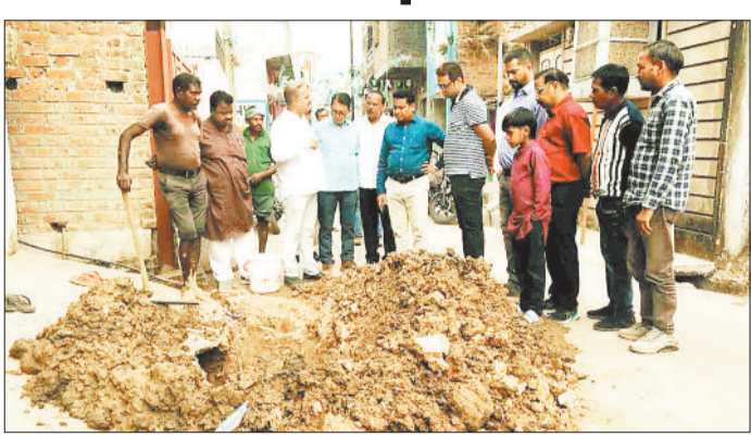
पाइप लाइन का निरीक्षण नवि नेता प्रतिपक्ष व अन्य।