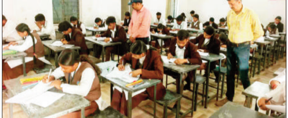
हायर सेकेंड्री मुख्य परीक्षा में शामिल हुए 7572 छात्र छात्राएं